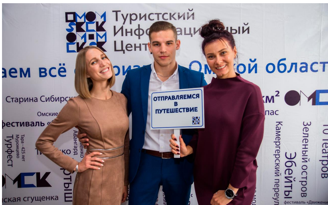
Ваш ТИЦ Омской области

На этом мы заканчиваем наше руководство, теперь дело за вами! Помните, для проведения акции не нужны деньги, не обязательно провести сразу 70 экскурсий – начинайте с малого, соберите команду людей с горящим глазами и проведите 2-3-5 экскурсий в вашем городе или селе! Маленькими шагами к большой цели.